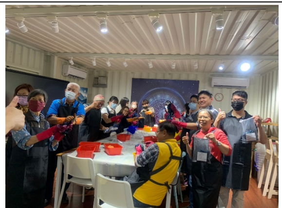
藍染手作課程體驗