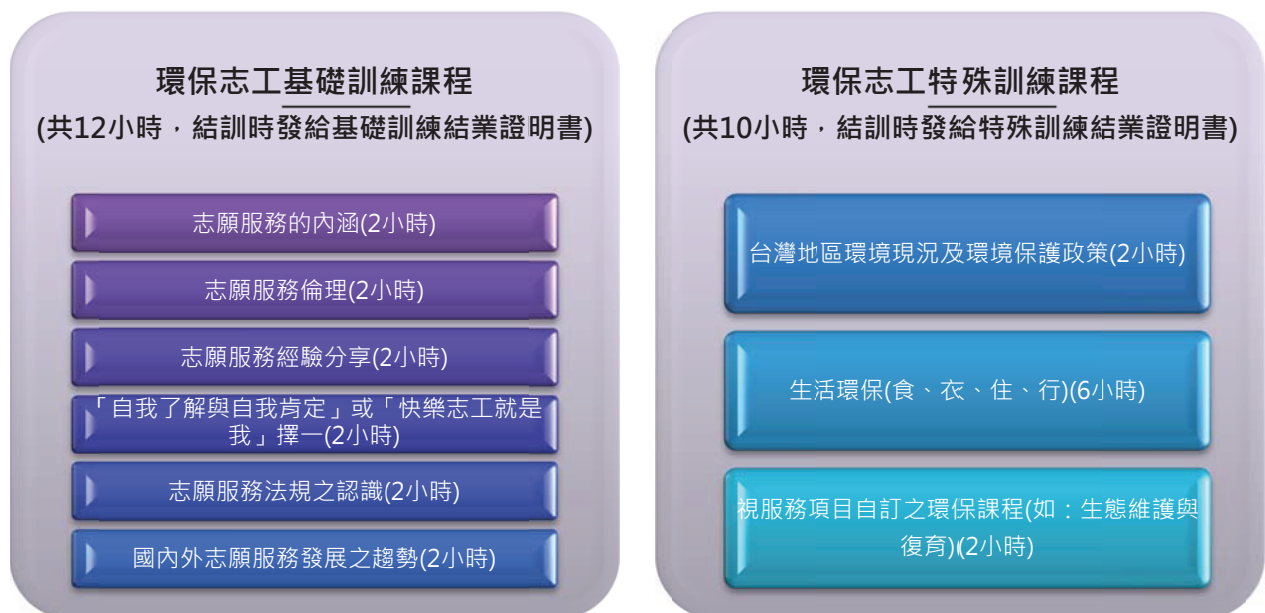
圖一 環保志工訓練課程規劃

本市環保志工訓練課程係依據志願服務法第9條規定略以，「為提昇志願服務工作品質，保障受服務者之權益，志願服務運用單位應對志工辦理下列教育訓練：一、基礎訓練。二、特殊訓練」，規劃課程說明如圖一：