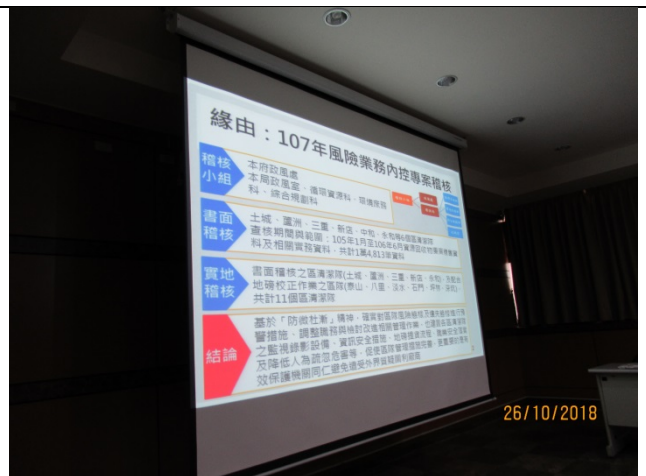
循環科專題報告-「資源回收物管理流程策進作為專題報告」剪影 (4)