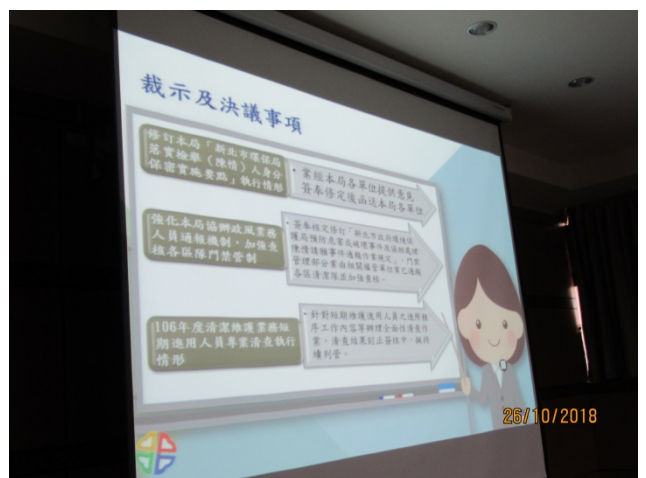
107 年度廉政會報 暨機關安全維護會報剪影 (3)