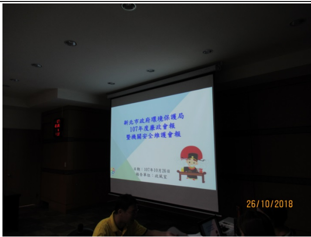
107 年度廉政會報暨機關安全維護會報 10 月 26 日上午 9 時於本局 402 會議室召開