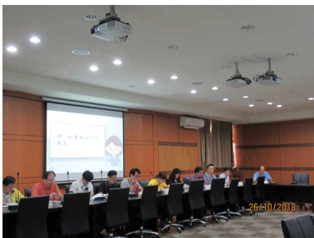
107 年度廉政會報 暨機關安全維護會報剪影 (2)