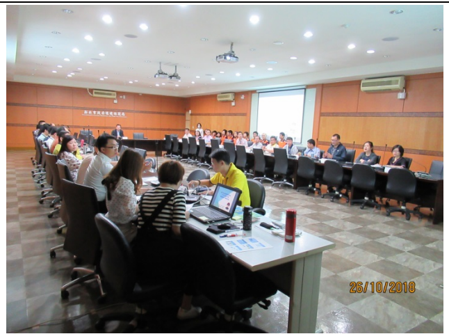
107 年度廉政會報 暨機關安全維護會報剪影 (1)