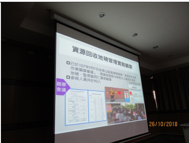
循環科專題報告-「資源回收物管理流程策進作為專題報告」剪影 (3)