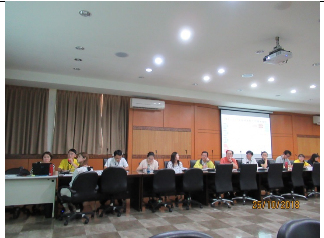
循環科專題報告-「資源回收物管理流程策進作為專題報告」剪影 (2)