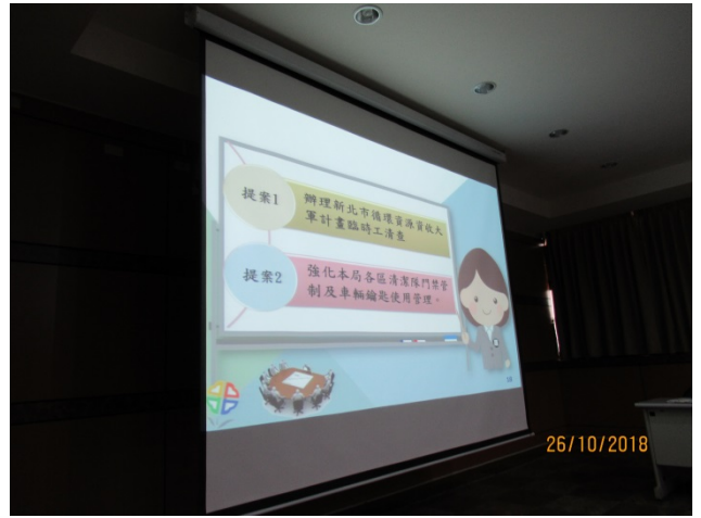
107 年度廉政會報暨機關安全維護會報剪影 (5)