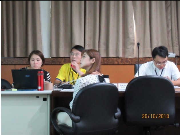
循環科專題報告-「資源回收物管理流程策進作為專題報告」剪影 (1)