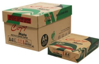
Copy Mate 環保影印紙 A4-80g