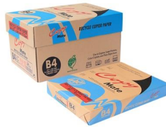
Copy Mate 環保影印紙 B4-70g