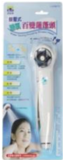
省水蓮蓬頭(按壓式)