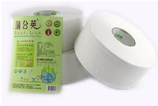
蒲公英環保大捲紙