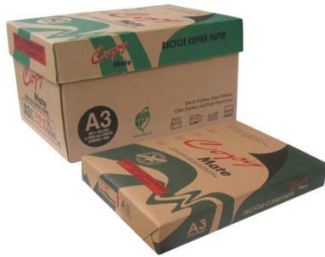
Copy Mate 環保影印紙 A3-80g