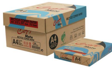
Copy Mate 環保影印紙 A4-70g