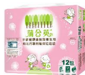
蒲公英新北市垃圾袋版衛生紙