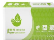
淨世代環保擦手紙