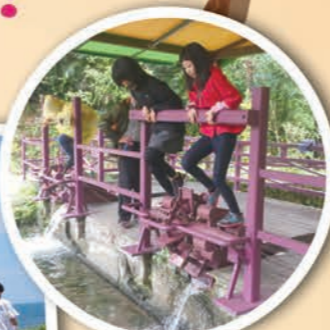
▲雙溪平林休閒農場，農村水車踩水灌溉體驗。