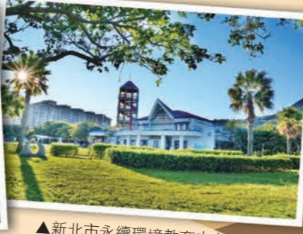
▲新北市永續環境教育中心

我們居住的新北市內，有非常豐富的生態與自然資源，以及多種風貌的文化：14個環境教育設施場所裡面，隱藏著不同的環境教育藏寶圖，等著大朋友與小朋友一起蒐集嘍！小朋友，你想要蒐集幾張呢？