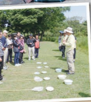
▲鹿角溪人工濕地，檢測水質我也行。