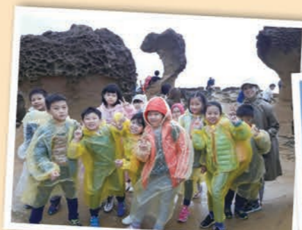
▼白沙灣自然中心，沙灘淨行式，大家一起來。