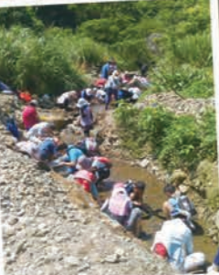
▲新北市瑞芳區金瓜石社區，獨特的位置與採礦產業，隱藏在霧中的神秘山城，走在其間，處處有故事。