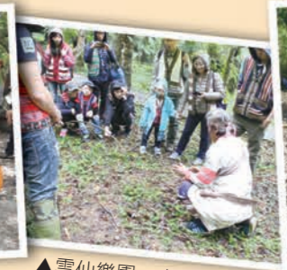
▲雲仙樂園，泰雅狩獵趣，體會泰雅勇士的生活！