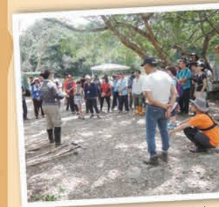
▲臺北水源特定區環境教育學習中心，我們都可以是水源地的守護者。