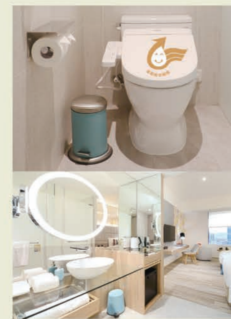
▲館內採用節能LED燈及具有金級省水標章馬桶。

相關訊息請至「行政院環境保護署綠色生活資訊網」 https://greenliving.epa.gov.tw 查詢。