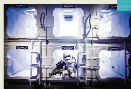
▲躺進膠囊艙裡，彷彿身處外太空，下一秒就要來場星際大戰。

各位小朋友大家好：相信大家知道「我們只有一個地球」，全世界各國也都不斷地推動各項環保的政策與辦理各相關活動。近年來環保署為進一步提升全民於住宿旅館時自備盥洗用品、續住不更換床單、毛巾及鼓勵業者推動環保作為，參考日本旅館推動綠色硬幣 (Green Coin) 之作法，推出環保旅店推廣計畫，藉由業者呼應消費者綠行動給予房價優惠、提供用餐優惠券、商品折價、套裝行程或旅遊景點參觀優惠等回饋，或自節省備品費用中提撥部分經費，贊助推廣環保活動，以鼓勵全民參與。因此，我們這一期Q&A就要跟大家介紹有關環保旅店的相關知識。