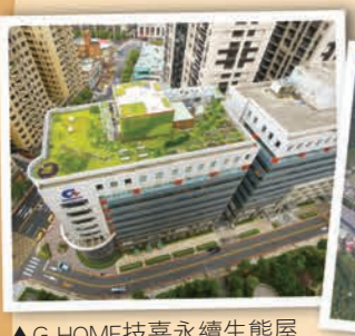
▲G-HOME技嘉永續生態屋頂(技嘉科技股份有限公司)，城市中的一點綠，人與環境共美麗。