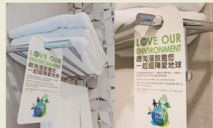
▲環保標語小卡鼓勵住宿兩天以上的旅客，重複使用毛巾，減少洗滌耗水量。

Q：除了臺灣之外，以下也來介紹幾個國際上較為有名的環保旅館認證制度讓小朋友知道。