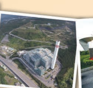
▲八里垃圾焚化廠，循環經濟的過程與價值。