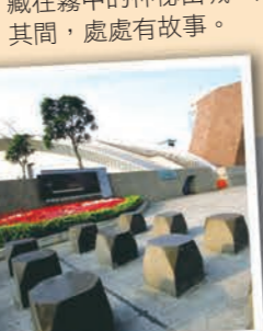
▲新北市立十三行博物館，建築隱含有考古發掘與先民乘船渡海來臺的精神。