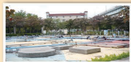
▲新北產業園區污水處理廠