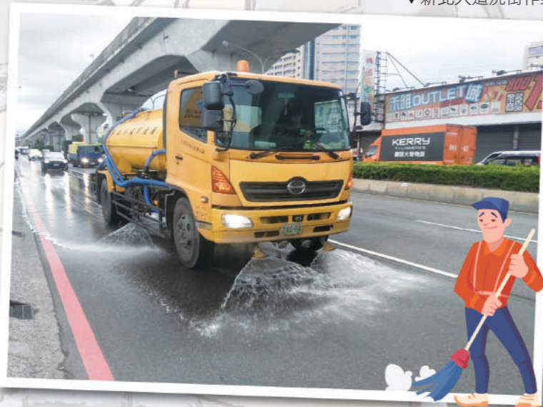
▼新北大道洗街作業

此外，新北市環保局有鑑於橋梁常有廢棄物或砂石掉落致污染路面，而廢棄物或砂石如未定期清理則會堵塞洩水孔，遇有強降雨時就會產生橋面積水情形，導致汽機車行駛過程水花噴濺或車輛打滑之風險，故針對轄內18座重要橋梁規劃有例行性清潔人員進行環境清理維護工作，每座橋梁排定每週清理維護至少1次，經統計每月約可清除1.5公噸廢棄物及2.4公噸泥砂。