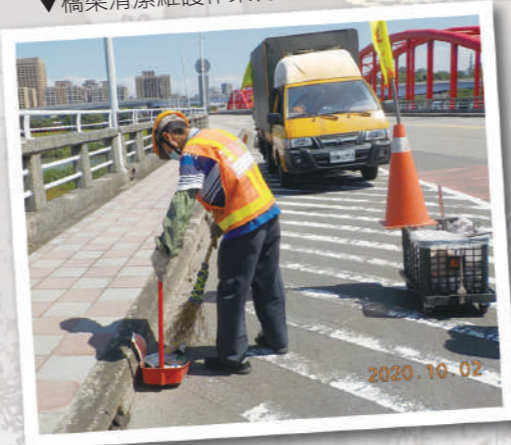
▼橋梁清潔維護作業(永福橋)

此外，新北市環保局有鑑於橋梁常有廢棄物或砂石掉落致污染路面，而廢棄物或砂石如未定期清理則會堵塞洩水孔，遇有強降雨時就會產生橋面積水情形，導致汽機車行駛過程水花噴濺或車輛打滑之風險，故針對轄內18座重要橋梁規劃有例行性清潔人員進行環境清理維護工作，每座橋梁排定每週清理維護至少1次，經統計每月約可清除1.5公噸廢棄物及2.4公噸泥砂。