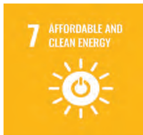
可負擔的 永續能源