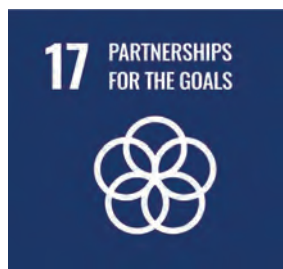
永續發展 夥伴關係