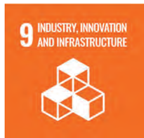
永續工業與 基礎建設