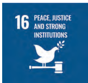
制度的正義 與和平