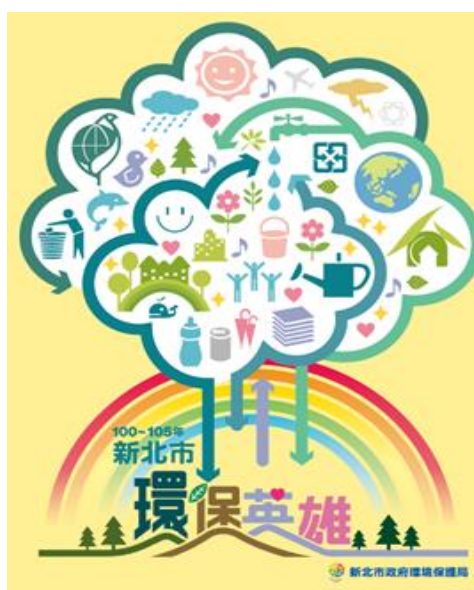
圖二 100-105年新北市環保英雄彙編

為積極打造本市各行政區域多元化、在地化及特色化之目標，期使透過歷年特優環保英雄典範移植，以經驗分享、現地輔導或觀摩體驗方式，使有意學習之志工或社區能發揮自主精神，提升智能與效率，共同參與環保工作，並號召更多市民以實際行動為本市創造更優質的環境，並促使環境永續發展理念更為深耕踏實。除了針對每年環保英雄得獎者(包括特優獎及優等獎)之優秀模範事蹟製作掛軸外(如表二)，也於105年將歷年(100-105年)榮獲特優獎及優等獎環保英雄之優秀模範事蹟進行編纂成冊，封面並以「資源循環再利用」之觀念呈現(如圖二)，進一步傳播和宣傳，讓更多人在環保模範的感召下，一同播灑環保的種子，為愛護台灣、永續地球盡一分心力。